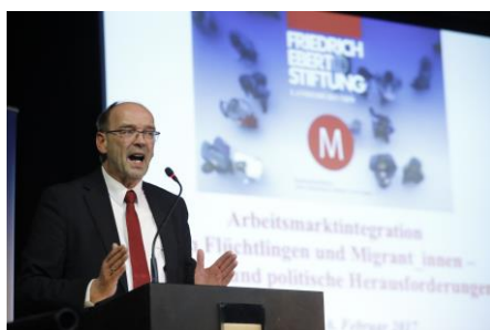
Rainer Schmelzter, Minister für Arbeit, Integration und Soziales in NRW

„Integration gelingt, wenn man sie vernünftig gestaltet“, davon ist Rainer Schmelzter überzeugt. Auf dem Gelände der ehemaligen Zinkfabrik Altenberg in Oberhausen präsentierte der Minister für Arbeit, Integration und Soziales des Landes Nordrhein-Westfalen den Mitgliedern des Managerkreises und ihren Gästen einen Statusbericht zur Lage der Geflüchteten am deutschen Arbeitsmarkt.